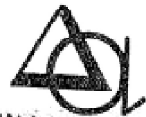
Fdo.: José Antonio Mateo del Puerto Alcalá Asesores, S.A.

ALCALA ASESORES, S.A C.I.F. A-78484292 Alcalá, 380 3 E Tels 368 05 02 . 377 41 50 28027 MADRID