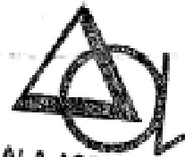
Fdo.: José Antonio Mateo del Puerto Alcalá Asesores, S.A.

ALCALÁ ASESORES, S.A. C.I.F. A-76454292 Alcalá, 300 3 E Tels 368 06 02 - 377 41 57 28027 MADRID